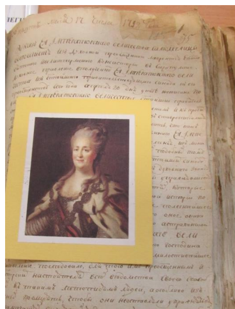
Рисунок 2 –Фрагмент копии приказа Екатерины II «Об архивном деле»

богат и уникален. Он служит источниковой базой исторических исследований.