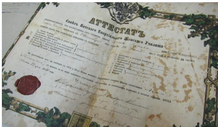
Рисунок 3 – Аттестат об образовании воспитанницы Вятского Епархиального Женского училища, 1869 г.